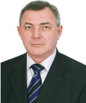
Чайка Валентин Васильевич фракция Всероссийской политической партии "ЕДИНАЯ РОССИЯ"