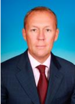
Луговой Андрей Константинович фракция Политической партии ЛДПР – Либерально-демократической партии России