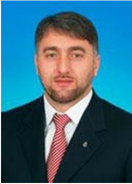
Делимханов Адам Султанович фракция Всероссийской политической партии "ЕДИНАЯ РОССИЯ"